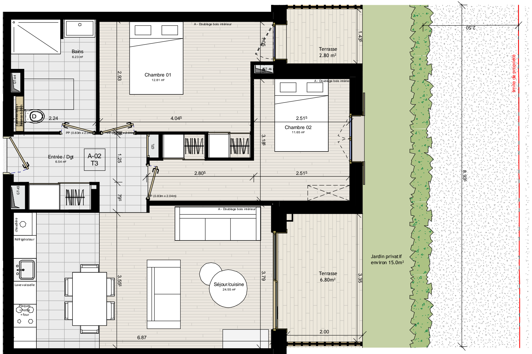
RDC - A02